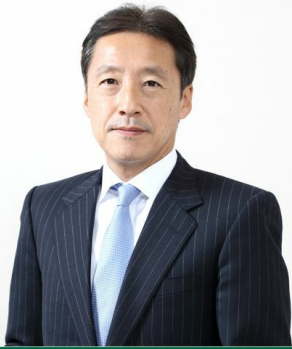
高家 正行 株式会社カインズ 代表取締役社長